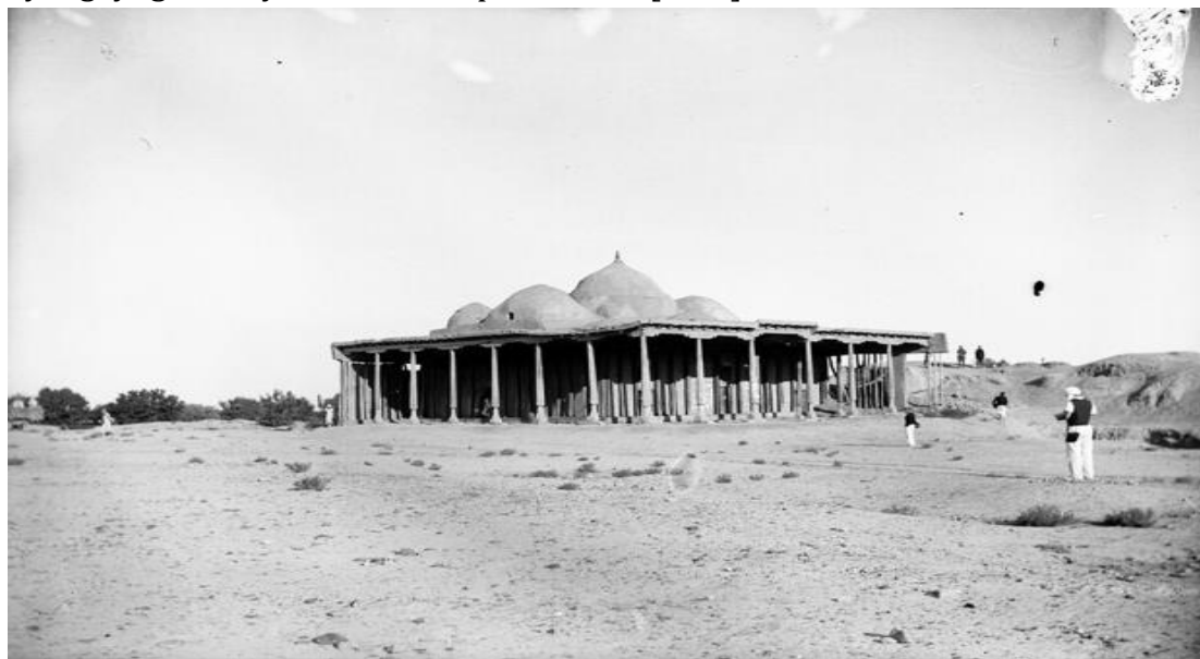
Deggaron masjidining XX asr boshlaridagi umumiy ko'rinishi (7-rasm)

Hazora masjidining arkalaridagi tishlar shunday festonlarning g'ishtda bajarilgan varianti hisoblanadi. Material shaklni aniq qayta tiklashga imkon bermagani sababli, festonlar archlar bilan emas, balki tekis bo'laklar bilan ifodalanadi. Boshqa yodgorliklarda uch bargsiz restoncha arkalar misollari ham uchraydi, masalan, X asrdagi Mashad Masrian mehrobida, XIII asrdagi Safid Bulandagi Shoh Fazil mavzesidagi tromplarda va XIV asrdagi Sayfiddin Boxarziydagi yog'och o'ymakorlik maqbaralarida [8-49].