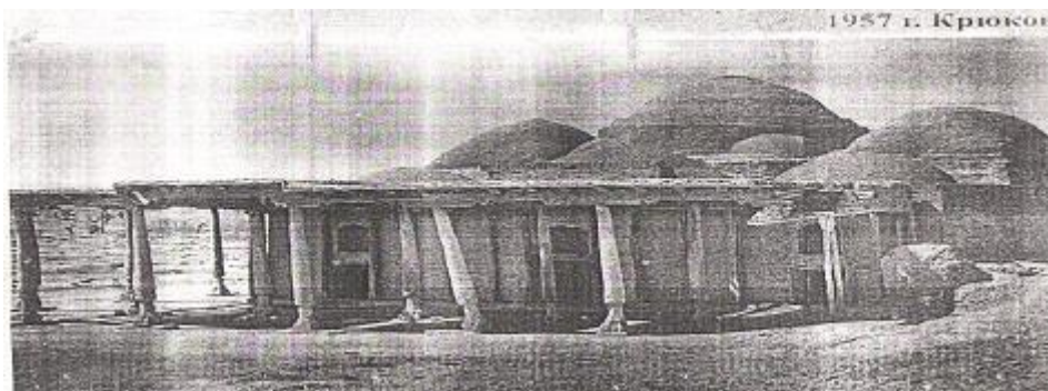
Deggaron masjidining 1937-yilgi ko'rinishi muallif N.Zasipkin (2-rasm)

adabiyotlarda ham tilga olinadi. Biroq mavjud manbalarning birortasida uning shakli va batafsil o'lchovlariga oid to'liq tahlili keltirilmagan[17-45].