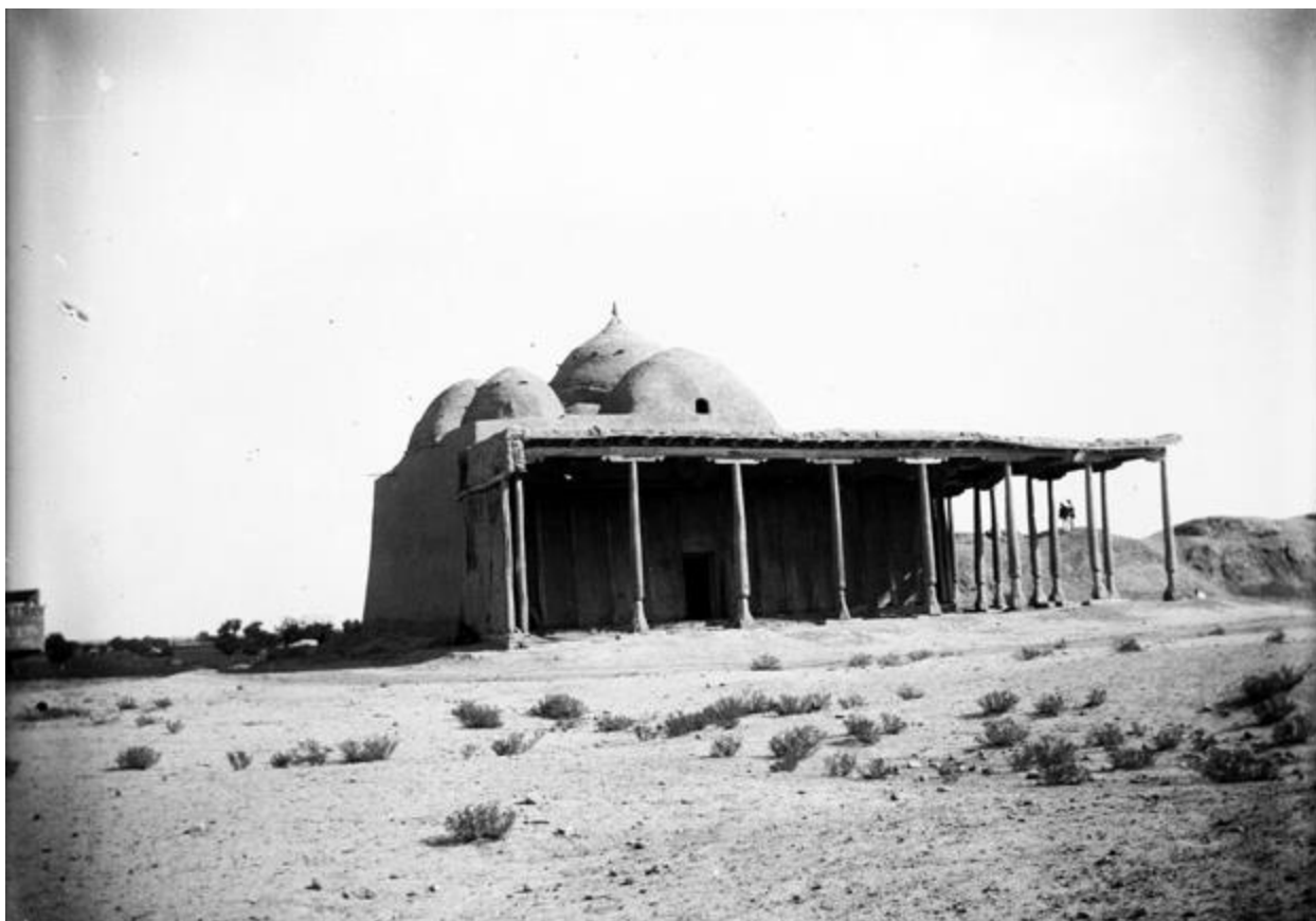
Deggaron masjidining XX asr boshida janubi-g'arbdan ko'rinishi (3-rasm)

Deggaron masjidi rejasi deyarli kvadrat shaklga ega bo'lib, tashqi o'lchamlari 15,0 m va 16,6 m, ichki o'lchamlari esa 13,75 m va 12,25 m ni tashkil etadi (4-rasm). Inshoot to'qqizta gumbaz bilan qoplangan bo'lib, markaziy gumbaz qolganlariga nisbatan balandroq turadi. Gumbazlar devorlarga hamda masjid ichidagi to'rt yirik yumaloq ustunga tayanuvchi o'tkir yoysimon kamarlarga tayanadi. Xom g'ishtdan qurilgan devorlar ichkaridan ham, tashqaridan ham loy-somon bilan suvalgan. Gumbazlar esa pishiq g'ishtdan barpo etilgan bo'lib, ichki tomoni ochiq qoldirilgan, tashqi tomoni esa loy-somon qorishmasi bilan qoplangan. Kamarlari va ustunlari ganch (alebastr) bilan silliqlangan.