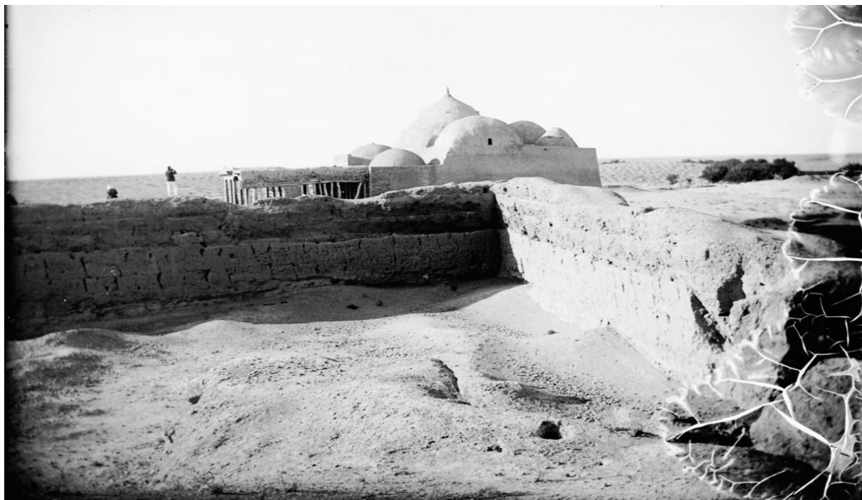
1937-yilgi Deggaroni masjidi (1-rasm)

Uzoqdan qaralganda, tekis dasht hududi joylashgan Hazora qishlog‘idagi Deggaron masjidining silueti 1 yaqqol ko‘zga tashlanadi 2 . Masjid zardushtiylar davri me‘morchiligi uslubida qurilgan.