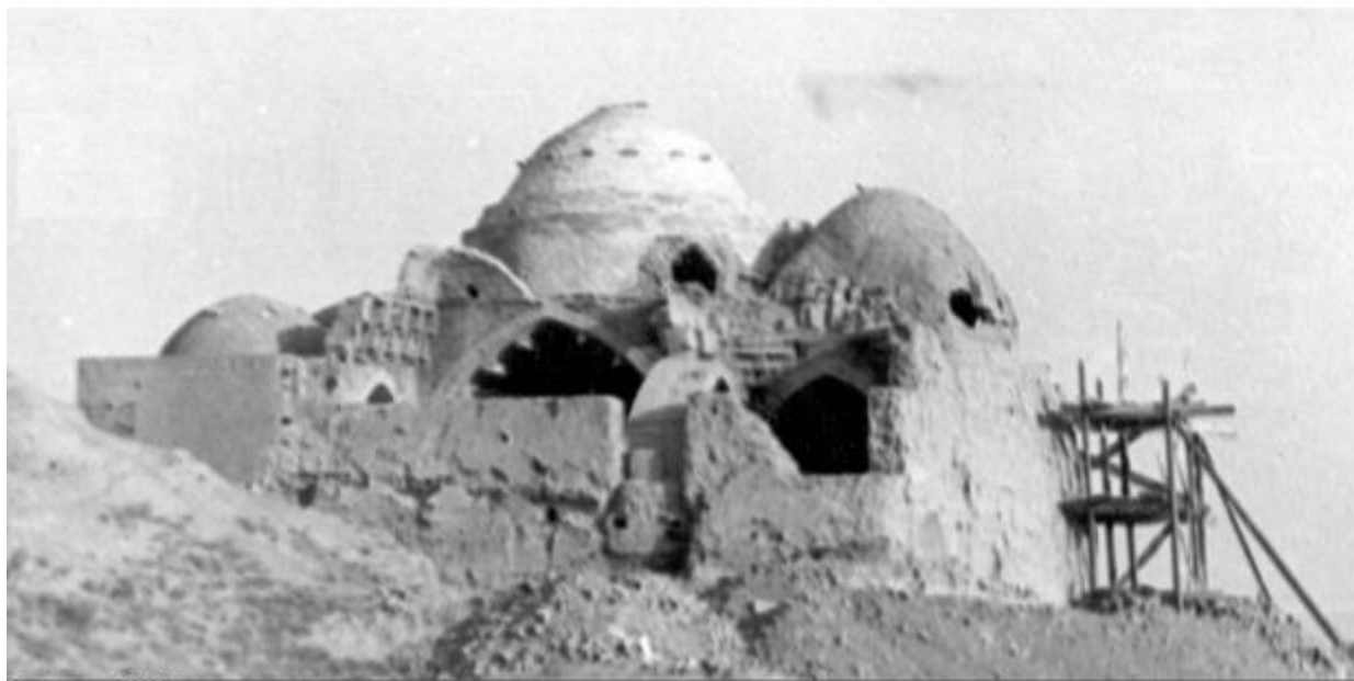
Deggaron masjidi restavratsiyadan oldingi holati (6-rasm)

Qoplamaning og'irligi devor va ustunlarga tushgan. Eski devorlarning qalinligi yuqoriga qarab keskin kamaygani sababli, tonirlardan kelib chiqadigan yon bosim ayniqsa xavfli hisoblanadi. Shu bois periferik gumbazlarga balandroq ko'tarilish berilgan bo'lib, bu konstruktiv yechim yon bosimni yumshatishga xizmat qiladi. Chekka gumbazlarning bevosita bosimidan tashqari, devorlar og'irlik va yon bosimni kamarlar orqali qabul qiladi. Gumbaz ostidagi devor qismlari konstruktiv jihatdan eng mas'ul zonaga kirganligi uchun, ularni pishiq g'ishtdan qurilgan deb taxmin qilish mumkin. Biroq bu faqat qisman tasdiqlanadi: gumbaz ostidagi 72 sm balandlikda tashqi tomondan ko'rinadigan qatlam pishiq g'ishtdan iborat bo'lsa-da, undan pastroq qism xom g'isht terimidan boshlanadi. Devorlarning konstruktiv tuzilishini o'rganish bu taqsimot barcha kamarlar uchun xos ekanligini ko'rsatadi.