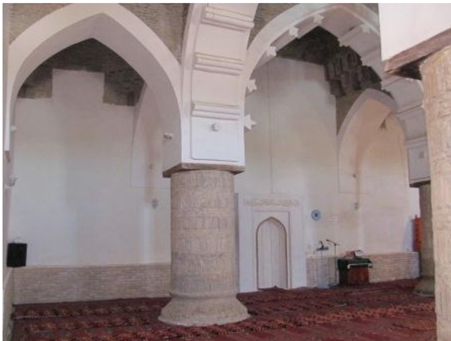
Degarron masjidining mehrobli devoir (5-rasm)

Muhokama. Masjidning arxitektura va konstruktiv jihatdan eng diqqatga sazovor unsurlaridan biri uning ustunlaridir. Ustunlarning perimetri 3.90 dan 4.14 metrgacha, diametri esa taxminan 1.24 dan 1.32 metrgacha yetadi. Ustun tanasi pishiq g'ishtdan navbatma-navbat joylashtirilgan qatlamlar bilan terilgan bo'lib, bir qator "qirradi bilan", uch qator esa "yassi" holatda terilgan. Ushbu g'isht terish usuli jami olti marta takrorlangan. Ganch bilan suvalgan va choklari silliqqlangan terim yuzasi tekis, jilo berilgan bo'lib, yoqimli va nafis teksturaga ega.